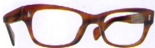
Brillengestell OLIVER PEOPLES, ca. 240 Euro; www.oliverpeoples.com

Diese Looks schmeicheln Fashionistas mit Babybauch bei jeder Wetterlage. Auf Thermometer schauen, Stil aussuchen und nachstylen!