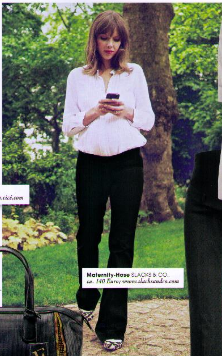
Maternity-Hose SLACKS & CO., ca. 140 Euro; www.slacksandco.com